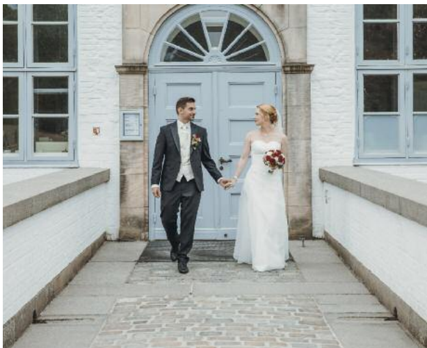
Heiraten im Schloss Ahrensburg