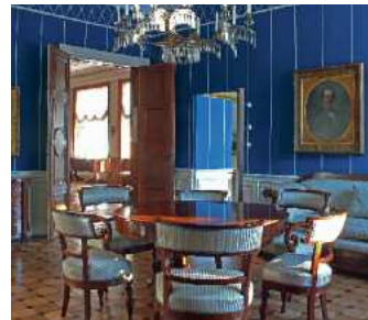
Das Blaue Wohnzimmer während und nach der Restaurierung