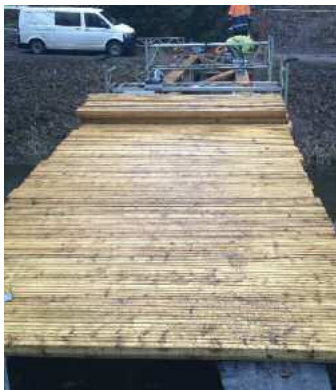
Die Holzbrücke erhält einen neuen Belag.