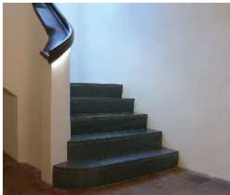
Die neue Treppe zum Gewölbekeller in verschiedenen Bauphasen