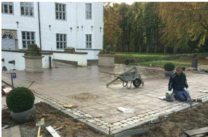
Der Vorplatz wird neu gestaltet.